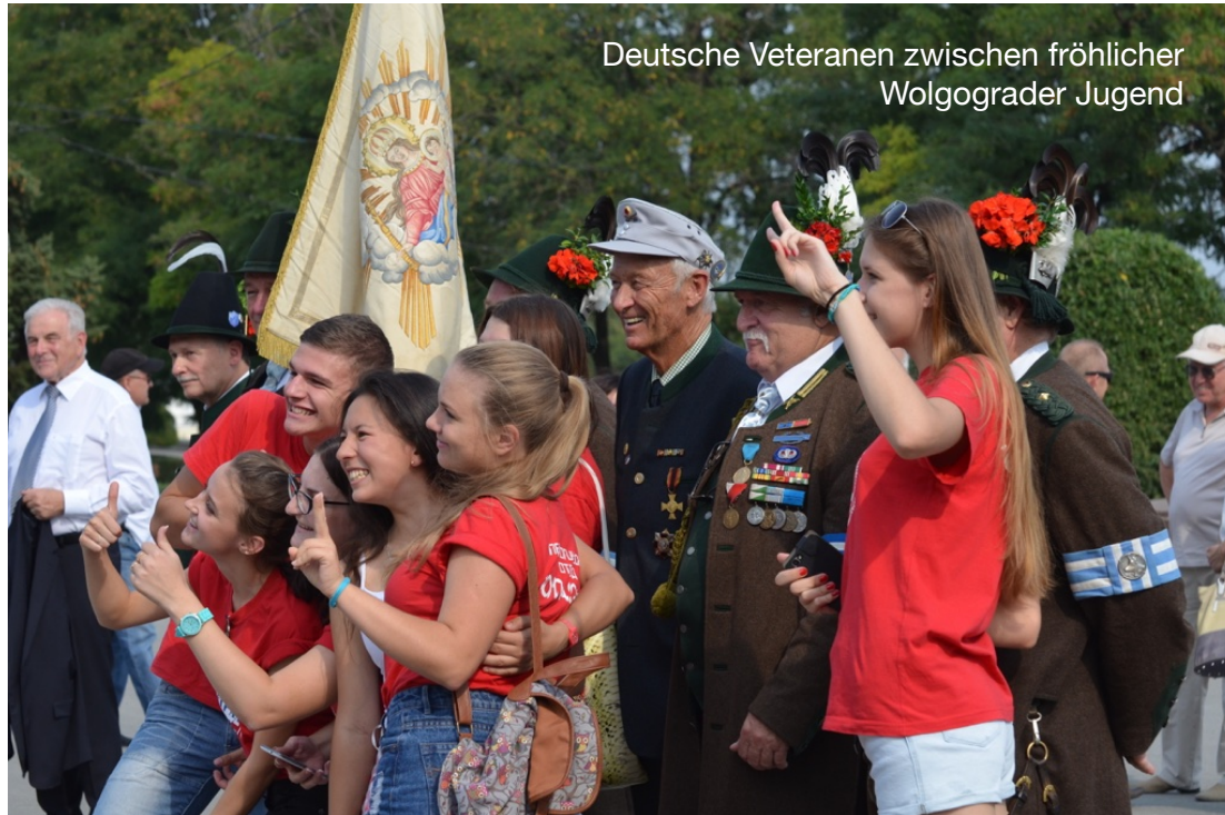
Deutsche Veteranen zwischen fröhlicher Wolgograder Jugend