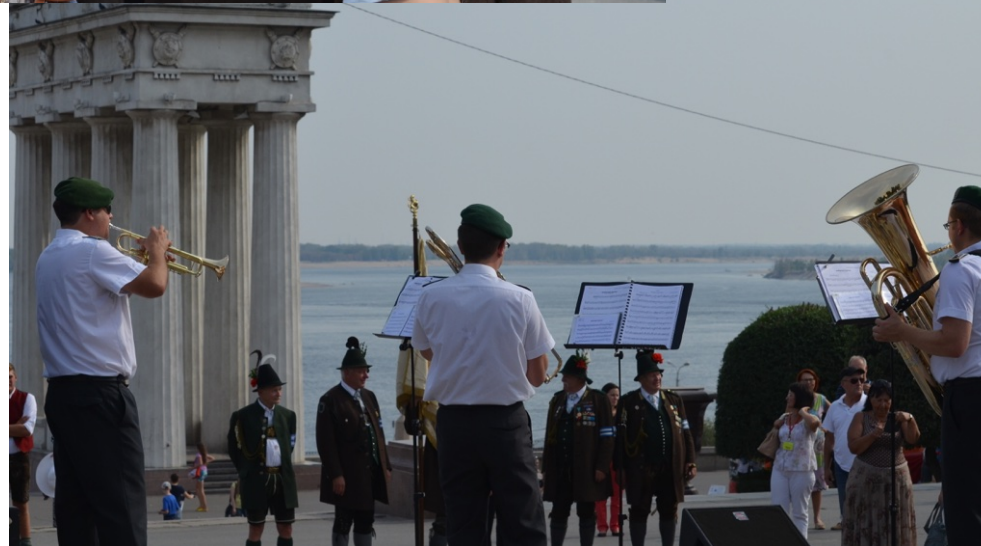
Das Bläserquintett der Bundeswehr und bayerische Gebirgsschützen