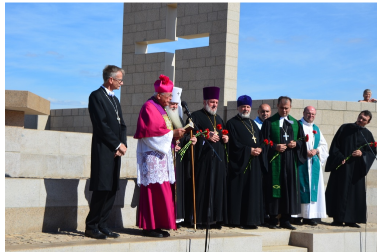
Weihe der Friedenskapelle durch die hohe Geistlichkeit

Der Wendepunkt des 2. Weltkrieges war die Schlacht von Stalingrad