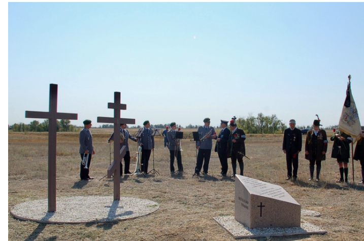
Bläserquintett und Veteranen beim ersten Spatenstich 2015